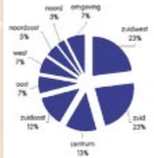
Herkomst leden binnen Enschede!

Op prestatiegericht niveau zijn er de afgelopen decennia vele successen te benoemen. Nederlandse records, Nederlandse kampioenschappen, internationale successen. Ook nu acteren enkele atleten van AC TION op het hoogste nationale niveau. Dit zowel individueel als in teamverband. Wist u bijvoorbeeld dat het herenteam van AC TION in de eredivisie meedoet? Dat wil dus zeggen bij de acht beste verenigingen van Nederland! In 2005 mocht AC TION de promotie- degradatie wedstrijd voor de eredivisie organiseren. De KNAU was hierover zo onder de indruk dat in 2006 AC TION zelfs het Nederlands Kampioenschap voor clubteams mocht organiseren.